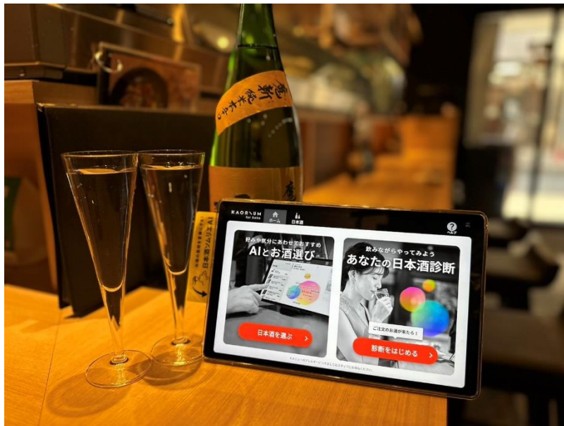
板前バル LIVE FISH MARKET 新宿店に設置している KAORIUM for Sake